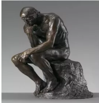
Огюст Роден. Мыслитель

веку — разум» (русская пословица). Тот, кто мыслит и говорит в духовности русской речи, используя для этого слова-родники духовных образов, не может быть многословным. Но каждое такое слово, — «слово Божье», становится деянием в направлении гармоничного развития Творения. «Краткость — сестра таланта», советовал своему брату А. П. Чехов.