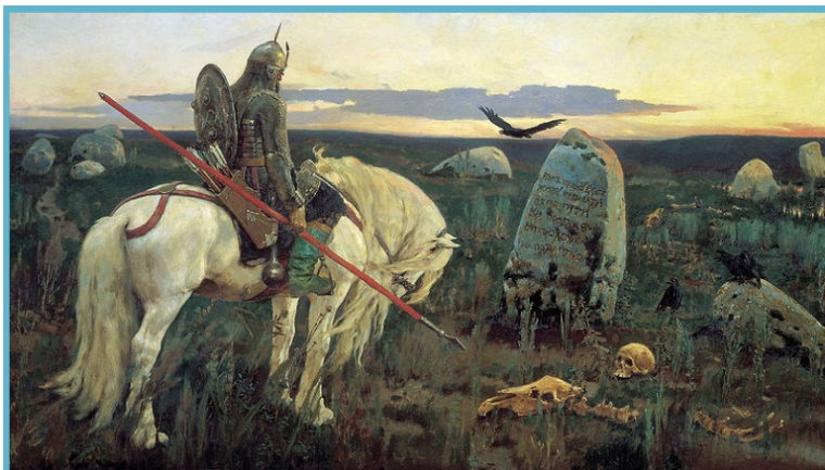
В.М.Васнецов «Витязь на распутье»

бах самовыражения и проявления человеческой индивидуальности, о заре свободной, ни от чего не зависящей «любви-секса» (с кем угодно и как угодно). Наблюдается засилье эротики и порнографии в театрах, кино, рекламных роликах на телеэкранах и особенно в интернет-пространстве. Со стороны ООН, соответствующими директивами 1 оказывается содействие продвижению этой дряни, например, гомосексуализма по всему земному шару, выдвигаются дополнительные требования к государствам, которые противятся пропаганде этой гадости-мерзости, отстаивая традиционные моральные и нравственные ценности. С позиции экспертов ООН всё это, якобы, должно способствовать возвышению рода человеческого через очищение его от всяческих «традиционных ценностей» и сотворение, таким образом, «благородного и свободного человека», за которым будущее!? И горе тому, кто посмеет хоть что-нибудь воз-