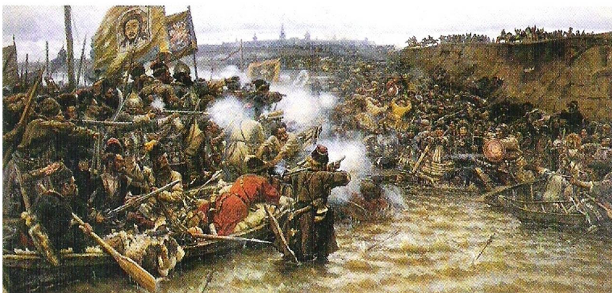
В.Суриков. Взятие Сибири дружиной Ермака. Время создания картины - 1895г.