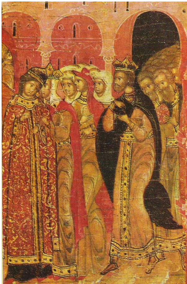
Икона ГРМ из Каталога выставки 1987 г. «Искусство Строгановских мастеров»

Практическая мощь Строгановых активно распространялась в их вотчинах на приобщение язычников к православию. В своем родовом гнезде на Вычегде это выражалось широким распространением интереса к искусству: храмовое коллекционирование русского типа, подкрепляясь женскими руками - созданием златотканых пелен и шитья. Всё это формировало для того времени высокую культурную