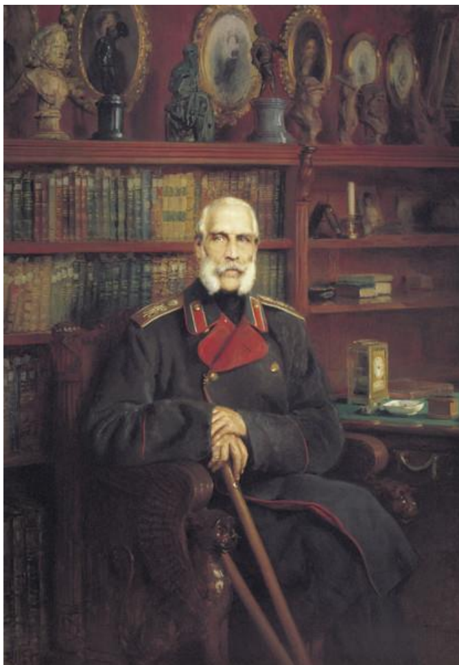
Портрет графа С.Г.Строганова

родословной собственного мужа, поэтому делала столь неуклюжие движения с целью