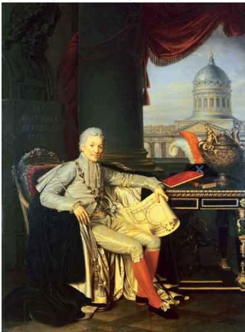
А.Варнека. 1814 г. Портрет А.С.Строганова

Начало XIX века в России ознаменовали очень противоречивые аракчеевские реформы. Павел I не мог не чувствовать то, как увеличивается грань размежевания с масонским сообществом в империи и сам пытался отделиться от этого сообщества в сооруженном им Михайловском замке. Однако братья с ним расправились по масонским же законам, заколов шпагой, символом которой он клялся кровью не нарушать масонское братство, в противном случае – давал согласие на подобную участь. Эта участь его как раз и постигла. Для остальных жителей империи, не ведавших о тайных обществах, была создана версия о смерти императора от «почечных коликов». На эту масонскую предусмотрительность Карамзин саркастически заметил: «Кто же в России