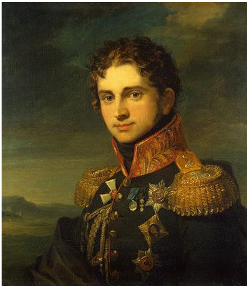
Генерал-лейтенант П.А.Строганов. Военная галерея Зимнего Дворца.

Совсем по-другому ведет себя Российский император. Александр I встречается с Наполеоном в Тильзите и 7 июля 1807 года подписывает с ним мирный договор. Согласно договора, Россия признавала за Наполеоном все его завоевания в Европе и становилась союзником в континентальной блокаде против Британских островов. В результате чего к осени 1809 года Россия оказывается в одиночестве перед наполеоновской Францией, которая добивается зенита своего могущества