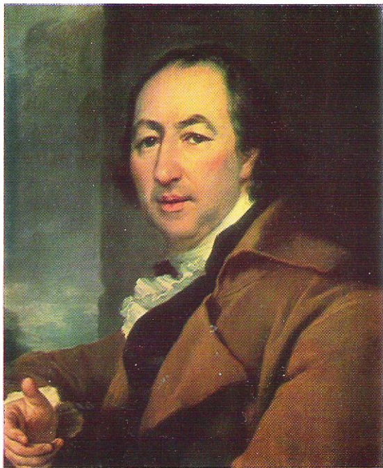
DMITRY LEVITSKY Portrait of the Writer Nikolai Novikov

В результате влиятельным сановником двора станет А.А.Аракчеев. Поэтому можно только догадываться о том, что могло бы произойти в России, если бы Новиков согласился сотрудничать. Во всяком случае, наступавшие времена уже несли с собой издержки революции во Франции. В качестве заразительного примера для российских братьев оставалась возможность работы тайных обществ Англии по образу и подобию отеснения монархии от власти.