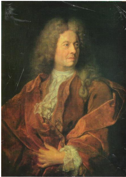
Неизвестный французский художник конца XVII века «Портрет мужчины в красном