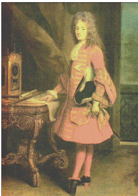
Р.Турньер. Около 1700г. «Портрет мальтийского кавалера»

Петра I это будет невосполнимой утратой. Он сразу же назначит Марью Яковлевну первой Статс-дамой Двора, чем на прежнем уровне обеспечит поддержку домом Строгановых всех своих начинаний. В этот промежуток времени, когда дети ещё не подросли и не были способны сами принимать решения, первая Статс-дама Двора не выпустит из рук нити управления обширным и богатейшим хозяйством в Российской империи и обеспечит поддержку политики Петра I. В то же время Марья Яковлевна не ослабит внимание за воспитанием своих детей, переживающих трудный этап