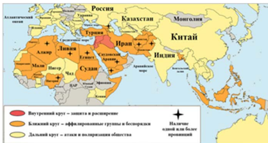
Глобальная стратегия Исламского государства [18]

О глобальных притязаниях исламистов можно, хотя бы приблизительно, судить по составленной в марте 2016 года карте, на которой обозначены их стратегические планы.