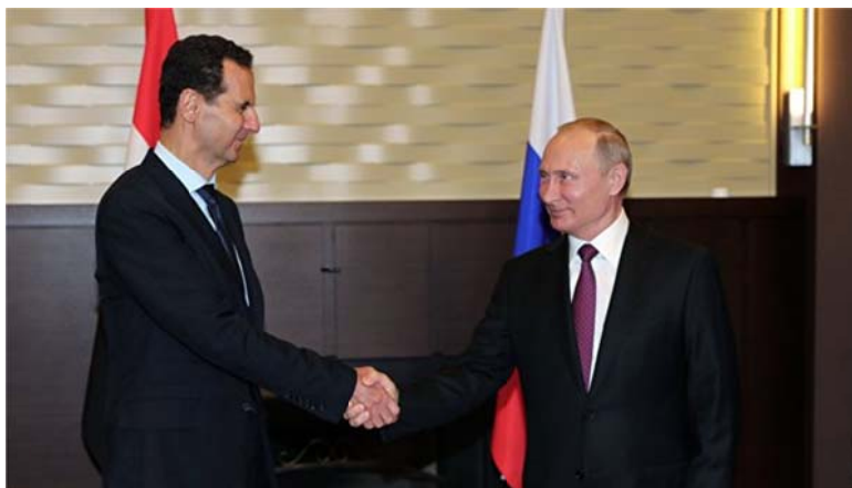
Встреча Владимира Путина и Башара Асада в Сочи 5 мая 2018 года

О союзнических и дружеских отношениях между Россией и Сирией с момента прихода к власти Хафеза Асада уже сказано достаточно. Добавим, что, помимо огромного экономического интереса, связанного с транспортировкой российского газа в Европу, о чём подробнее будет сказано в разделе об эмирате Катар, исключительно важное для России значение имеет её военное присутствие в Сирии. Прямая военная помощь со стороны России заметно укрепила положение сирийского правительства, которое до этого было довольно шатким, а по мнению некоторых обозревателей практически безнадежным. В портовом городе Тартус на постоянной договорной основе дислоцированы корабли ВМФ России. Это опорный и пока единственный пункт военно-морского присутствия России в Средиземном море и вообще в дальнем зарубежье, скромно именуемый пунктом материально-технического обеспечения , хотя ведутся работы по его превращению в полноценную военно-морскую базу. 18 января 2017 года Россия и Сирия подписали соглашение о расширении территории ПМТО и заходах военных кораблей РФ в порты САР сроком на 49 лет. А в районе Латакии на авиационной базе Хмеймим дислоцирована созданное 30 сентября 2015 года для проведения операций по поддержке правительственных войск в войне с исламистами формирование Военно-воздушных и Воздушно-космических сил РФ. Но полной идиллии в отношениях даже между Россией и Сирией нет и быть не может.