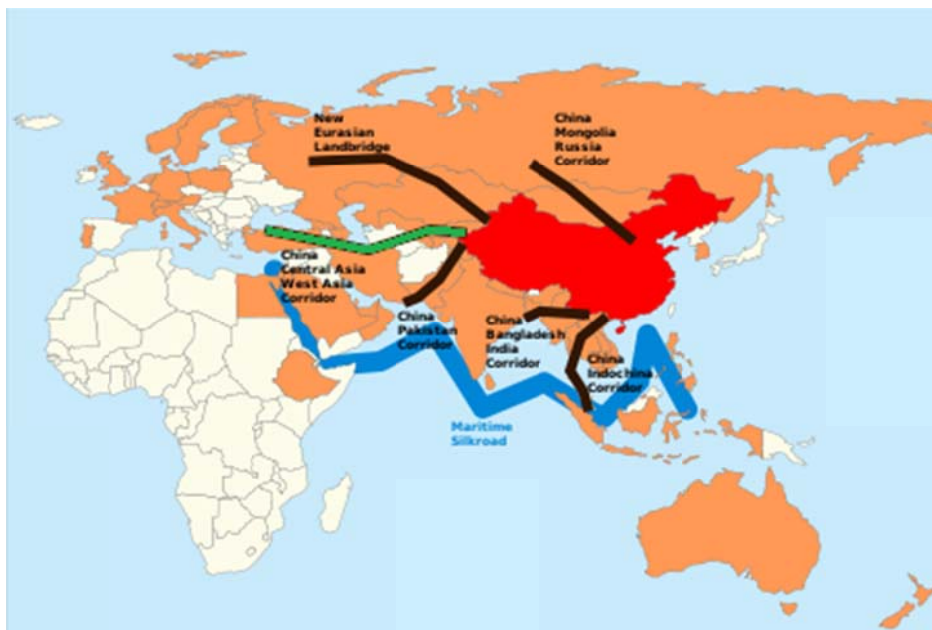
Маршруты китайского проекта «Один пояс и один путь» [21]

Словом, Китай , как говорят, хочет выиграть войну в Сирии без единого выстрела . А насколько реалистичен такой проект – покажет будущее.