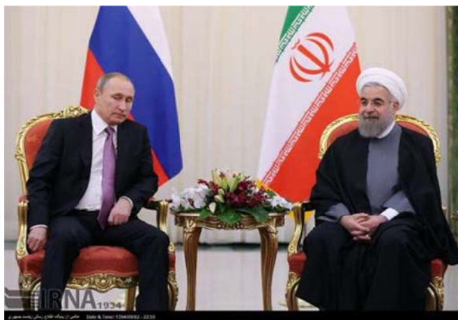
Встречи президентов Владимира Путина и Хасана Рухани в Тегеране 24 ноября 2015 года

Далее, то, что когда-то разделяло страны и служило источником военного противостояния, сейчас уже не столь актуально, хотя определённый интерес и интрига сохраняются. Ранее воевали за Кавказ, Прикаспие, иногда север Ирана, затем почти вся эта территория отошла к Российской империи, позже Советскому Союзу, после развала которого в составе РФ остался Дагестан и некоторые области Северного Кавказа, а на остальной территории возникли государства Южного Кавказа. И Россия и Иран имеют, конечно, свои немалые интересы в этом относительно небольшом, но стратегически важном регионе, через который проходят и прокладываются основные коммуникации с Востока на Запад, с Севера на Юг и наоборот, однако былого соперничества уже нет и в обозримом будущем едва ли предвидится.