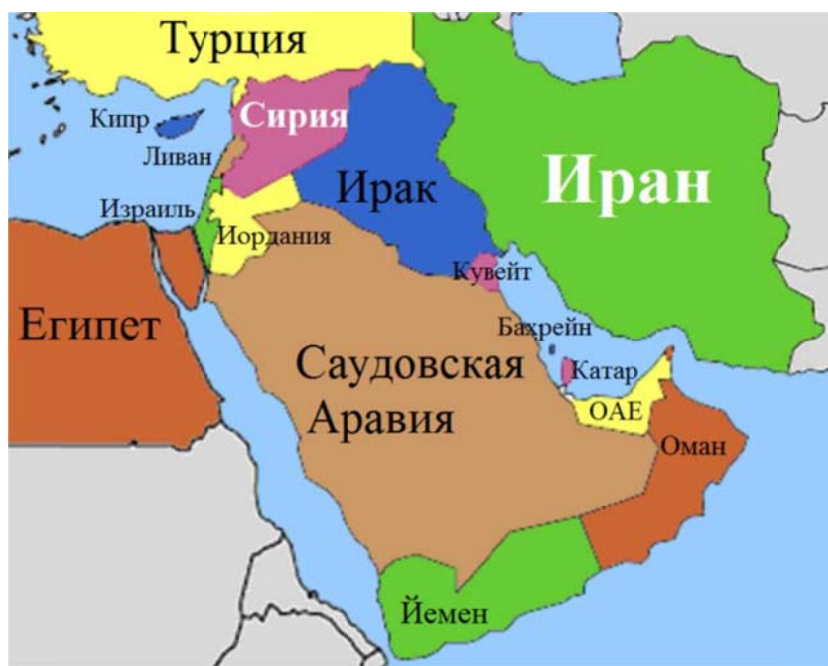
Иран на карте Ближнего Востока

Внешнеполитические приоритеты государства зависят от целого ряда причин и обстоятельств большей или меньшей значимости, среди которых важное место принадлежит религиозному фактору. Последний особенно характерен для мусульманского мира с его разделением, начиная с VII века, на два основных направления в исламе – суннизм и шиизм. Сунниты, на долю которых по имеющимся оценкам приходится не менее 85% всех мусульман, составляют абсолютное большинство верующих во многих исламских странах и не имеют своего, хотя бы и неформального, центра. У шиитов, число которых порядка 200 млн, такой центр есть. Это один из активных участников сирийского кризиса, Исламская Республика Иран, в которой шиизм является государственной религией.