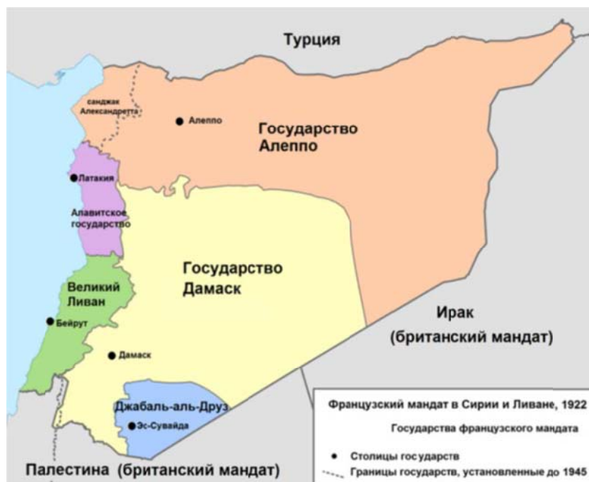
Квазигосударства на территории Сирии [3]

В 1939 году, в канун Второй мировой войны Турция, с согласия Великобритании и Франции, в качестве взимаемой с них за счёт Сирии платы за свой нейтралитет, аннексировала, переименованный в Хатай Александреттский санджак. Выгодно расположенный на берегу Средиземного моря прекрасный уголок сирийской территории с центром в Антиохии – одном из наиболее значительных городов средиземноморья в эпоху античности и средневековья, крупнейший центр раннего христианства, колыбель христианского богословия – был отторгнут от Сирии в угоду турецким амбициям и геополитическим интересам западных держав.