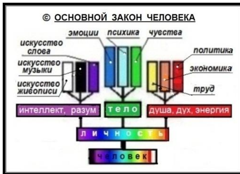
Рис 2. Основной Закон Человека