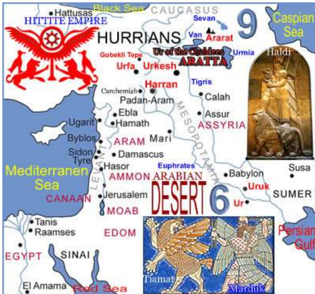
Рис.3 – Родина Авраама (Уркеш и Аратта)