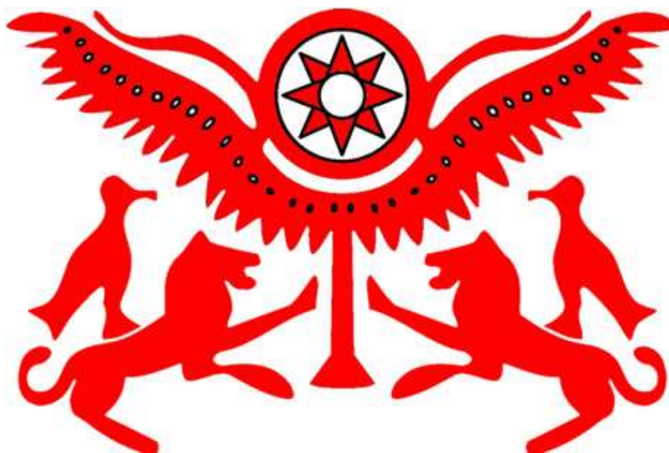
Рис.1 – Герб государства Митанни

Симптоматичен тот факт, что значительным влиянием в Митанни обладал народ, имеющий прото-индоиранские корни, о чём свидетельствует его «митаннийский арийский язык». Этот индоевропейский лингвистический субстрат был обнаружен в хурритских текстах с упоминанием Бога договора и общественного согласия Митры, как и других арийских божеств: Индры, Варуны, Сурьи и т.д. Официальной же государственной религией Митанни был культ Орион-Арийского солнца, обозначением которого (гербом Митанни) являлось изображение крылатого солнечного диска, с обеих сторон которого «дозорят» символизирующие энергию Солнца лев и орёл (Рис. 1).