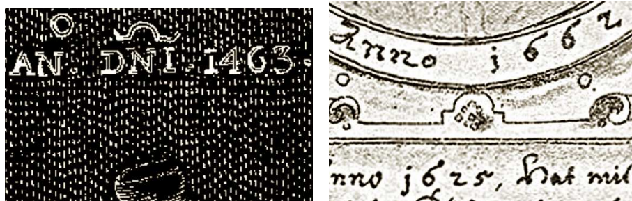
Рис. 50 Так менялось написание дат в «средние» века. От греческого I - Isus, до латинского J - Jesus.

Произношение имени также Христа претерпело фонетические изменения. Из Исуса сначала получился Иисус, позже, уже в латыни, вполне себе гласная I дала жизнь новой, полугласной – J, что и отразилось в изменении написания букв. Появился уже Jesus, в соответствии с фонетическими изменениями. Примерно как-то так: Уля – VLIA – IVLIA – IULIA – JULIA – Юлия... Заимствованное имя, как не поверить.