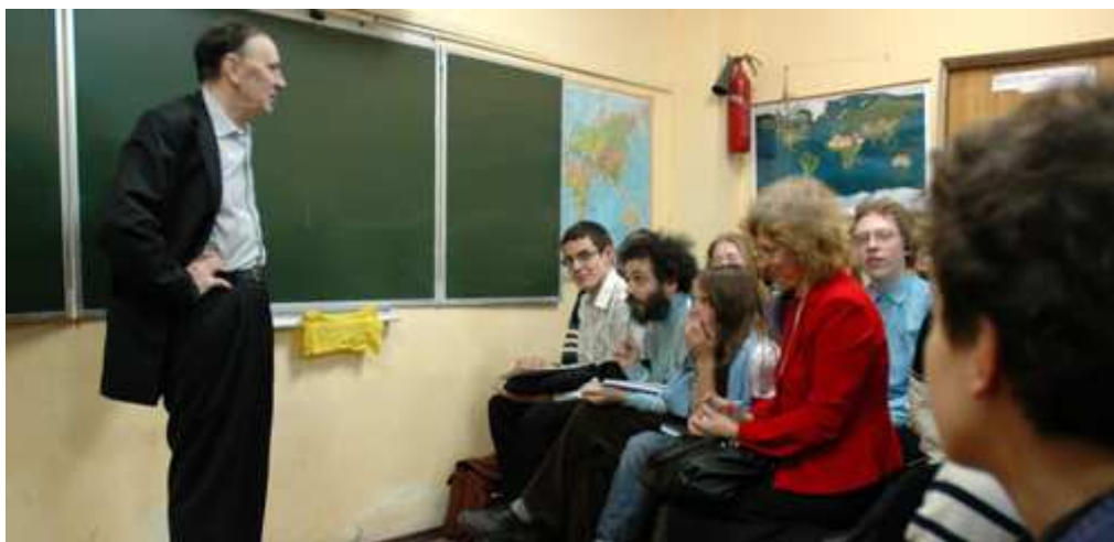
Рис. 53 А.А. Зализняк на лекции:

«...ну, хлеб слово заимствованное, так что не будем его рассматривать...»