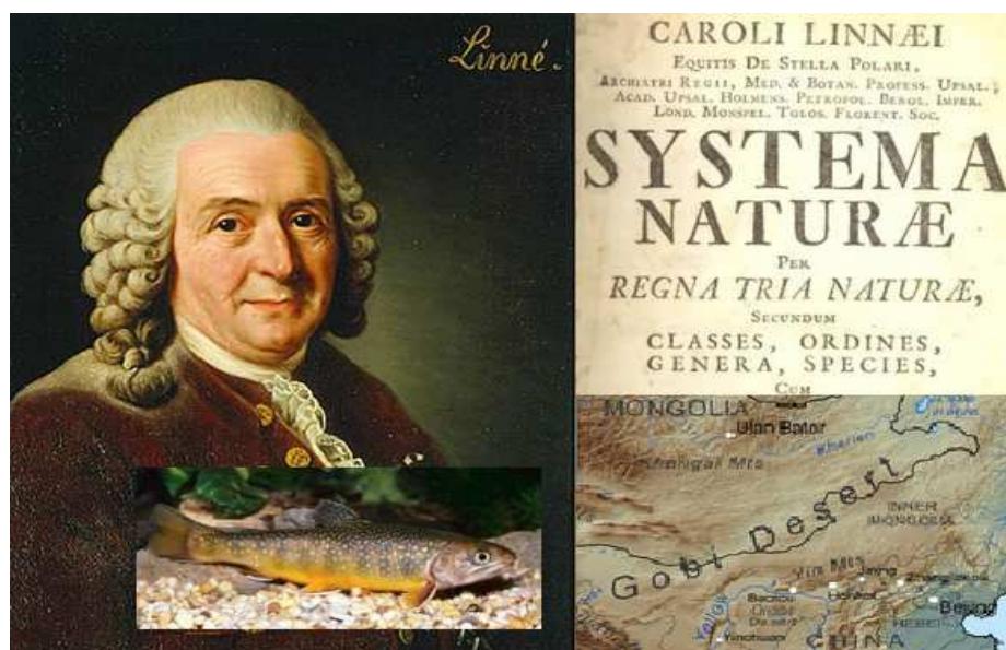
Рис. 52 Если Скалигер попался на шкале хронологии (scale), то Линней – на линиях собственной классификации животных. Песок - Гоби – gobio - пескарь – pisce – fish. Nature – начать, classes - класть, ordines - урядить, genera – жена, spec – зреть (вид).

Что же касается языка «древнегреческого», и латинизированных языков Европы, то в них полно словоформ, образованных в духе – говорим Партия, подразумеваем – Ленин. Слово партия начали писать с большой буквы, а Бог – с маленькой. Результат не задержался.