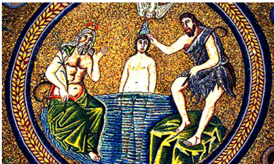
Рис. 49 Мозаика из Равенны (фрагмент).

Судя по тексту книги, Я А. Кеслер тоже «проехал мимо»: