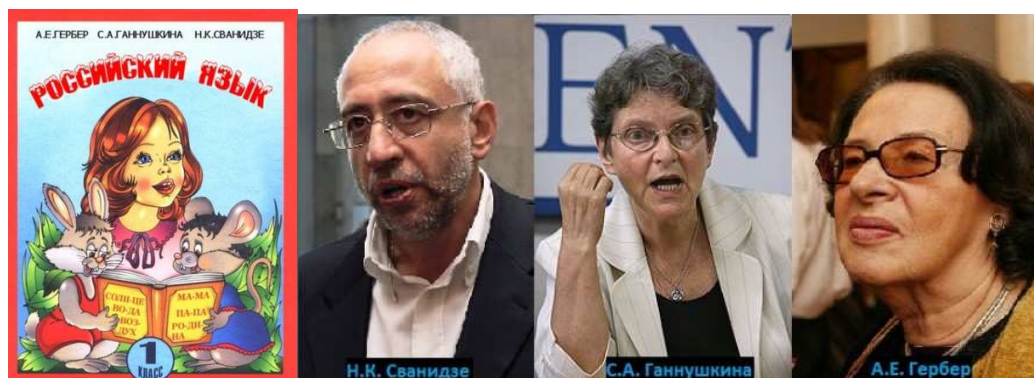
Рис. 47 Специалисты по несуществующим языкам, такое тоже встречается. И новый алфавит, как можно видеть, уже не за горами. По идее, они должны быть в казённом доме. Неважно, какого цвета дом, серого или жёлтого, жалюзи на окнах ведь всё равно будут, а это главное. ( жалюзи- от слова железо?)

Если создатели древнегреческого и латыни столкнулись с проблемой «шипящих» согласных букв из конца русского алфавита, что привело их к вольному или нет созданию слов с одинаковыми корнями, но разным смыслом, то в русском языке исключение большого количества носовых и различающихся по длительности гласных звуков привело к сходному результату. Под упрощением же очень часто прячется элементарная примитивизация, вполне возможно, сознательная. На последующем этапе языку могут просто сменить название, скажем, с русского на российский , после чего последует смена «неудобного» и «громоздкого» алфавита. Ещё позже начнётся «дежавю» из-за проблем с написанием слов типа бить-быть или вить - выть , которое приведёт к последующим ноу-хау . И уже следующее «похохление» вырастет в стальной уверенности, что «так» всегда говорили их прадеды.