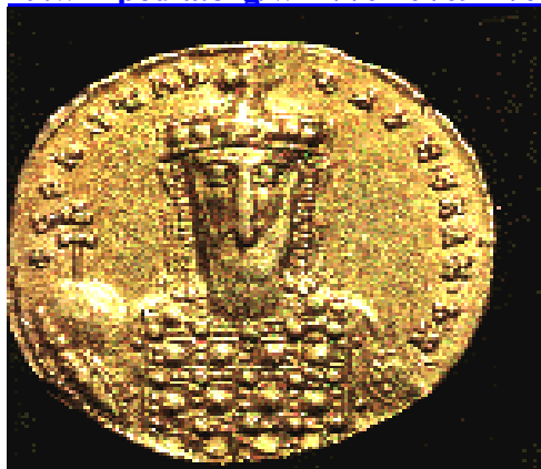
другое монетное изображение Константина