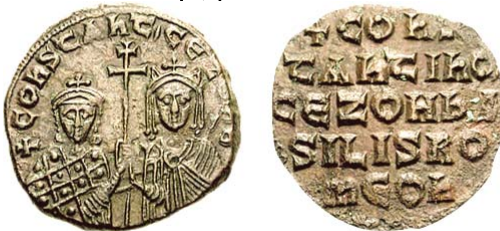
Монета времен Константина и его матери Зои

Понятно, 1060-летие средневековому названию России (Росии) – не слишком великий и круглый юбилей. Но это повод еще раз осмыслить историческое единство славянских государств Восточной Европы и Азии, да и их исторических соседей. Русские летописцы считали, что это единство шло с первого послепотопного времени – около 3264 г. до н.э. Это античное единство языческих народов летописцы обозначали средневековыми ононимами «Роусь, чудь и вси языци».