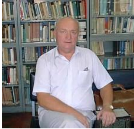
Фото в библиотеке кафедры математики и информатики Университета Эдуардо Мондлане (Мапуту, Мозамбик, 1999 г.)

математики и информатики было наличие в ней прекрасной библиотеки, в которой была собрана прекрасная коллекция книг по математике и информатике (такой библиотеке может позавидовать любая кафедра математики на территории России или Украины – вот вам и отсталая страна Мозамбик!). Кафедральная библиотека стала одним из мест моего частого времяпровождения в период работы в этом университете. И там меня однажды сфотографировали для кафедрального сайта.